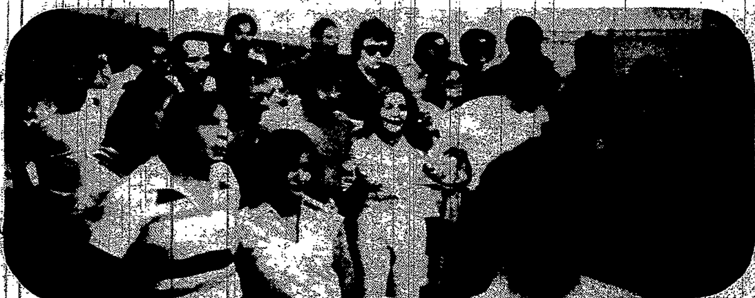
Los matrimonios Hispanos que los dias 9, 10 y 11 de Junio, pasaron la experiencia del Fin de semana Matrimonial, siguen con todo entusiasmo reuniendose y alimentando sus matrimonios. Married couples who participated in the first Marriage Encounter for Hispanics in June, still meet, plan and work together.